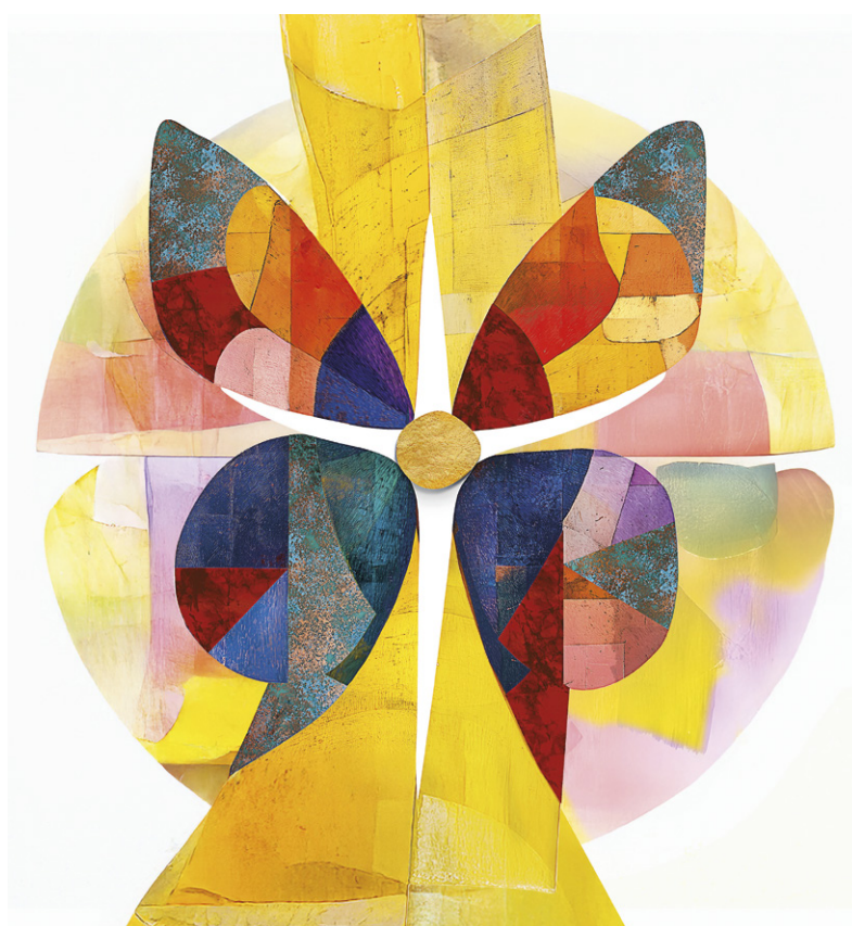
Symbol auf unserer neuen Osterkerze

Schon früh haben Christen in dieser Metamorphose ein Sinnbild der Auferstehung gesehen. Kirchenväter deuteten den Schmetterling als Bild für den Übergang vom Tod zum Leben. Auch in der Antike war er ein Symbol der Seele – im Altgriechischen bedeutet «Psyche» sowohl Seele als auch Schmetterling. Die Vorstellung dahinter: Wie der Falter seine Hülle zurücklässt, so überschreitet das Leben eine Grenze, die zunächst endgültig erscheint.